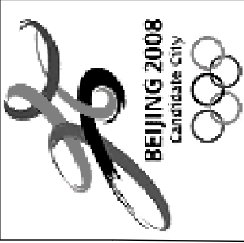
En skam: Den Olympiske komité besluttet å la Kina arrangere Sommer-OL i 2008.

Kina blir i dag gitt den samme beskjeden. Den Australiske atleten Kathy Freeman satte den moralske tonen da hun fortalte Reuters AT "Jeg kan bare trekke paralleller mellom Kina og Australia ... Vårt nulleblad i behandlingen av mine forfedre, urinnvånere i Australia, er skrekkelig." Mao, enhver fortidig synd som et sivilisert land er skyldig i er den moralske ekvivalenten til en nasjon uten fri presse, ingen rett til en rettferdig rettergang, ingen beskyttelse fra å bli skutt