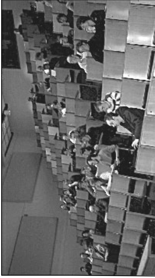
Publikum: Over femti personer hadde møtt frem for å overvære begivenheten. Blant publikum fant man både unge og eldre, kvinner og menn, liberalister og sosialister.

Dette er en politisk idé som er basert på oppfatningen om at ethvert individ fra